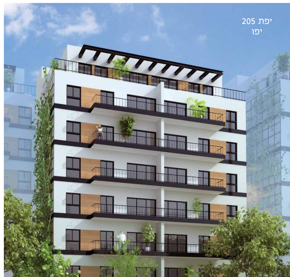
יפת 205 יפו