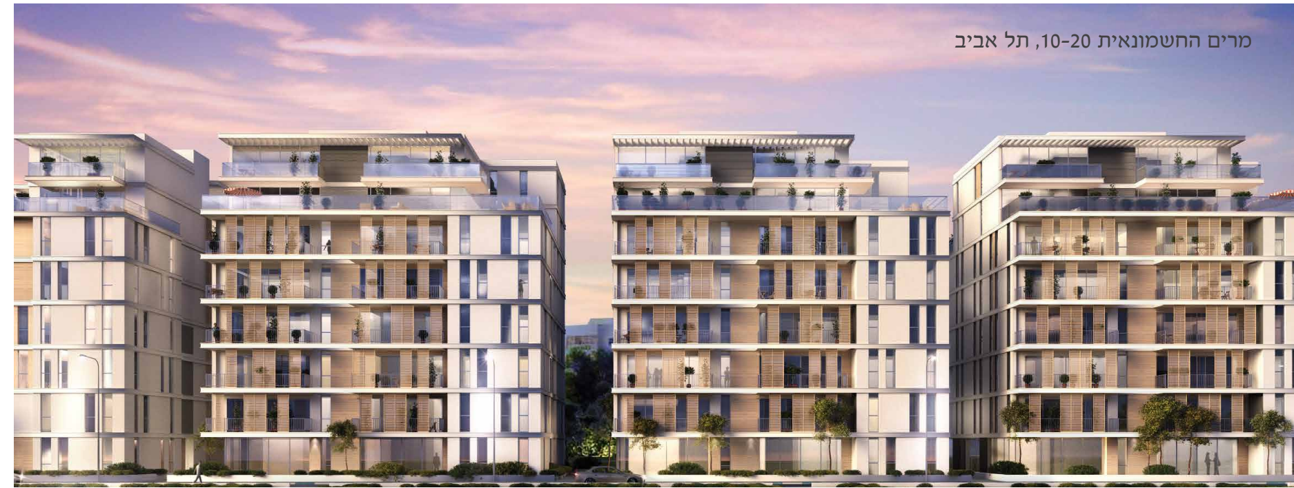
מרים החשמונאית 10-20, תל אביב