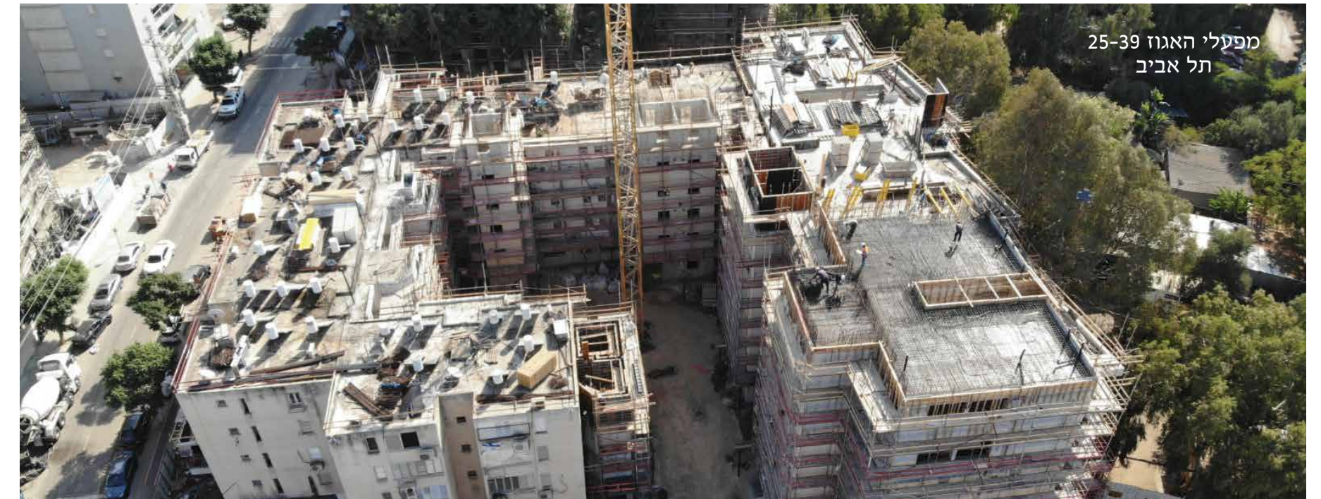
מפעלי האגוז 25-39 תל אביב