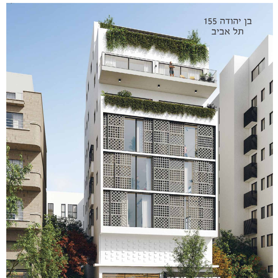
בן יהודה 155 תל אביב