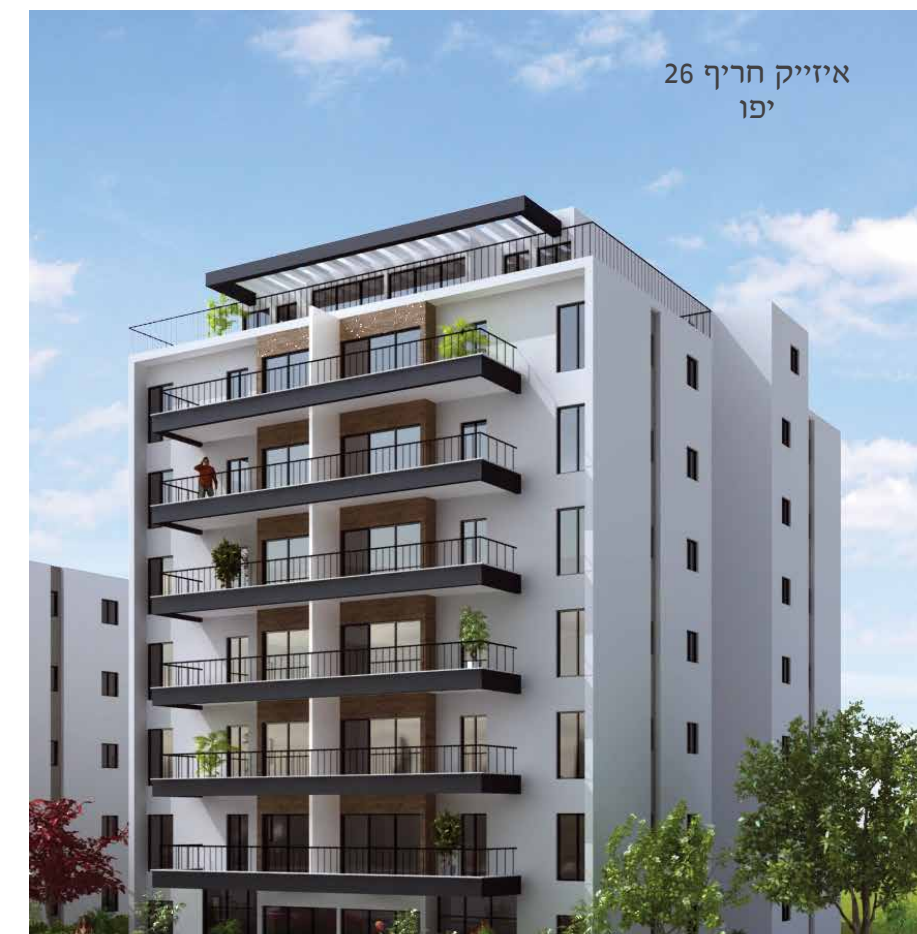
איזיק חריף 26 יפו