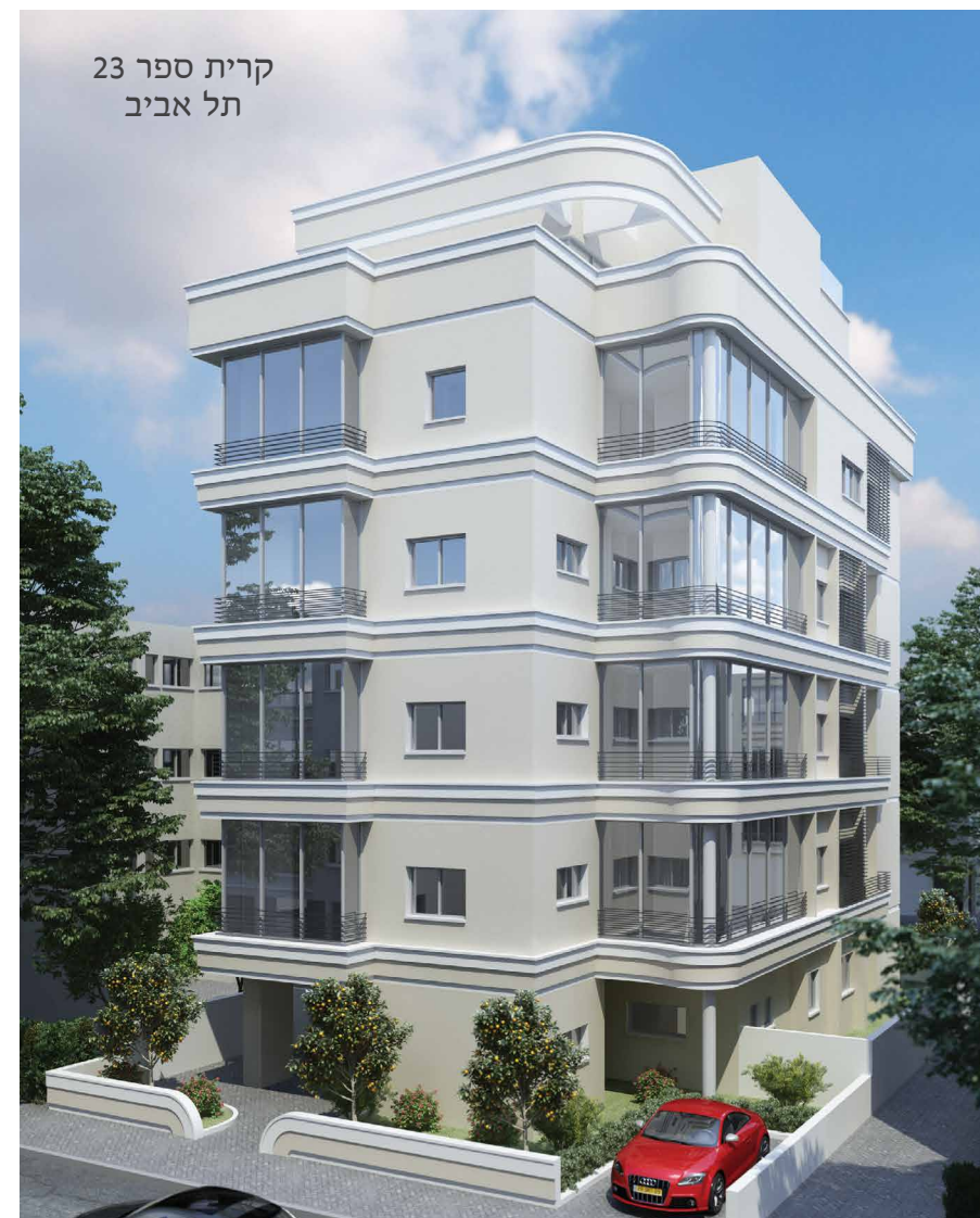
קרית ספר 23 תל אביב