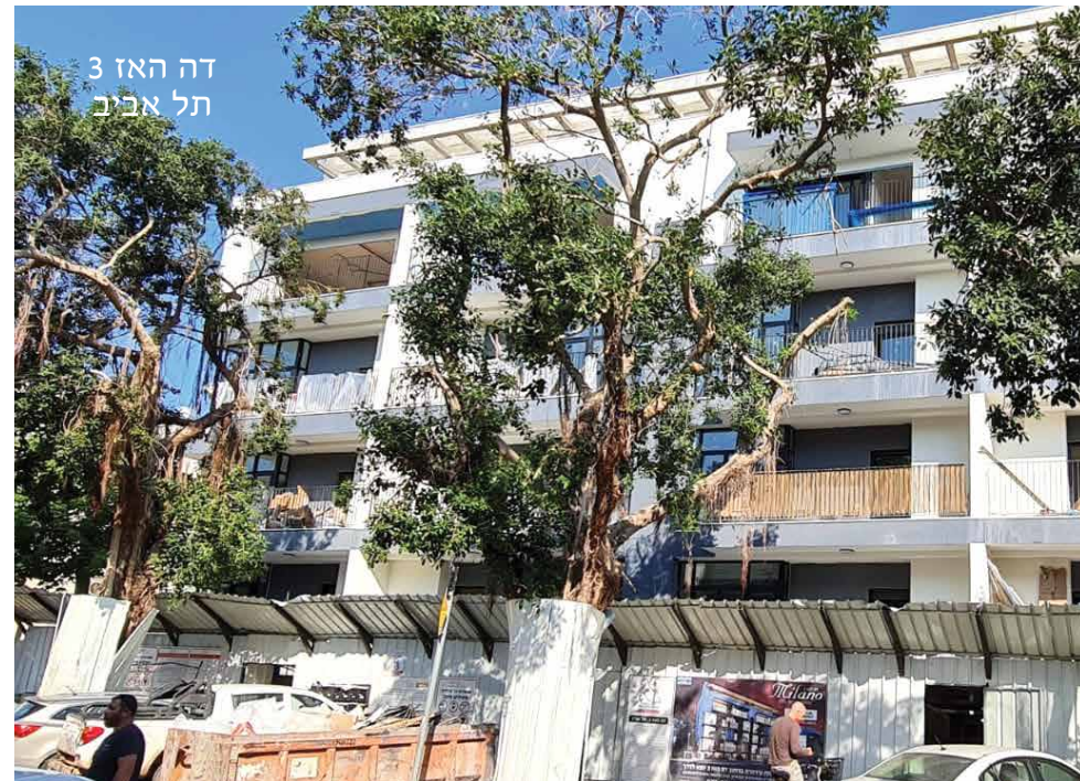
דה האז 3 תל אביב