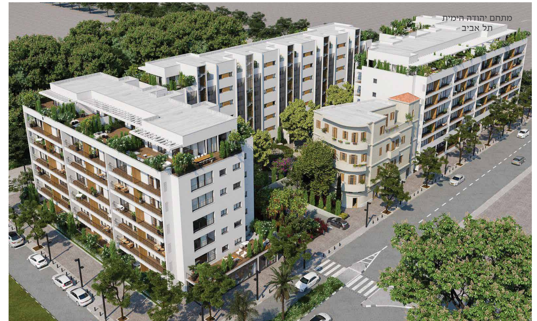
מתחם יהודה הימית תל אביב