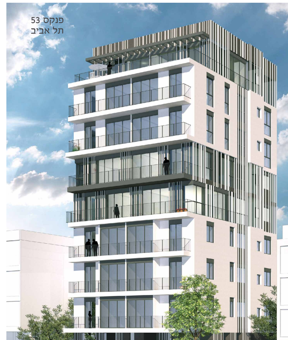
פנקס 53 תל אביב